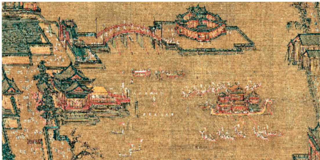
南宋(1127—1279年)张择端(传)《金明池争标图》(局部) 28.5×28.6cm 绢本设色 天津博物馆藏

画作左下角有“张择端呈进”五字款识，其风格似乎与《清明上河图》一脉相承，但作者和年代尚有争议，有专家认为是宋人临仿张择端笔意绘制，我观画时也觉判为张择端所绘不妥，但不妨碍这幅画作具有极高的艺术与史料价值，不仅其界画创作水平的成熟度之高实在让人叹为观止，而且是研究宋代建筑、体育、民俗的顶级实物图证。