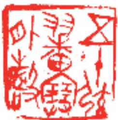
选自「岳阳市第七届书法篆刻作品展」