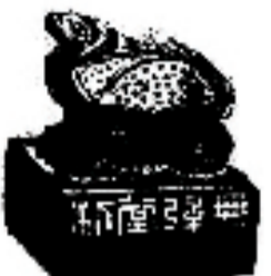
余瑾莹 平江无弦堂朱迹(局部)