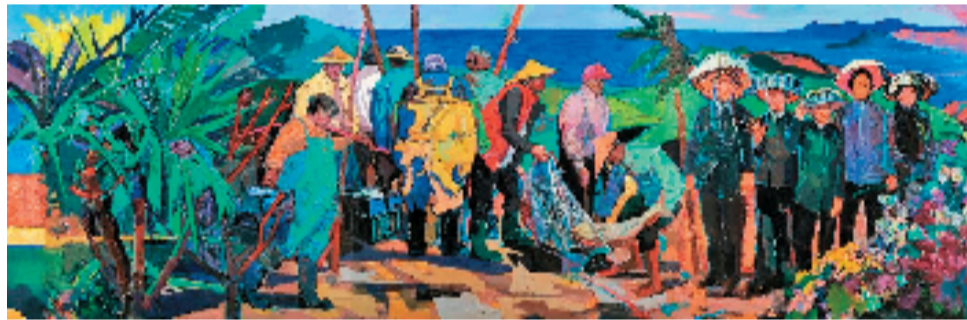
集体创作 奇迹(局部) 180x540cm 油画 2026年

本报讯 通讯员 杨子 由中国美术馆、深圳市文学艺术界联合会主办的“奇迹——深圳经济特区百米油画长卷创作展”于6月21日至7月1日在中国美术馆举办。