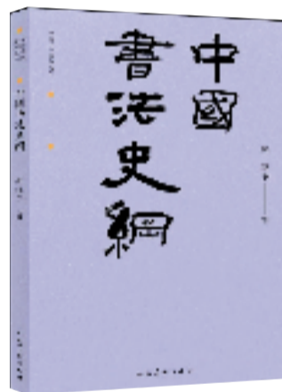
·《中国书法史纲》 ·郑晓华/著 ·人民美术出版社/出版

该书是中国古代艺术学理论经典文献研究丛书之一。主要探讨了中国古代艺术如何对人类及其社会发挥积极的作用，阐释了艺术活动背后人的主观动机和价值追求。全书以历史发展时序为轴，串联起横向的艺术功能理论分析，史料翔实，内容丰赡，揭示了中国古代艺术功能多元一体格局的内涵及其内在逻辑关系。