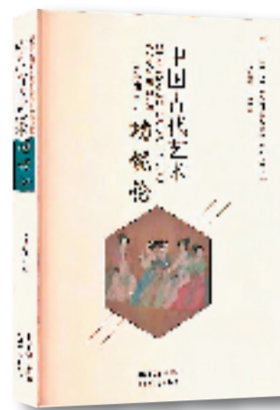
·《中国古代艺术功能论》 ·吴彦/著 ·山西教育出版社/出版

该书是中国古代艺术学理论经典文献研究丛书之一。主要探讨了中国古代艺术如何对人类及其社会发挥积极的作用，阐释了艺术活动背后人的主观动机和价值追求。全书以历史发展时序为轴，串联起横向的艺术功能理论分析，史料翔实，内容丰赡，揭示了中国古代艺术功能多元一体格局的内涵及其内在逻辑关系。