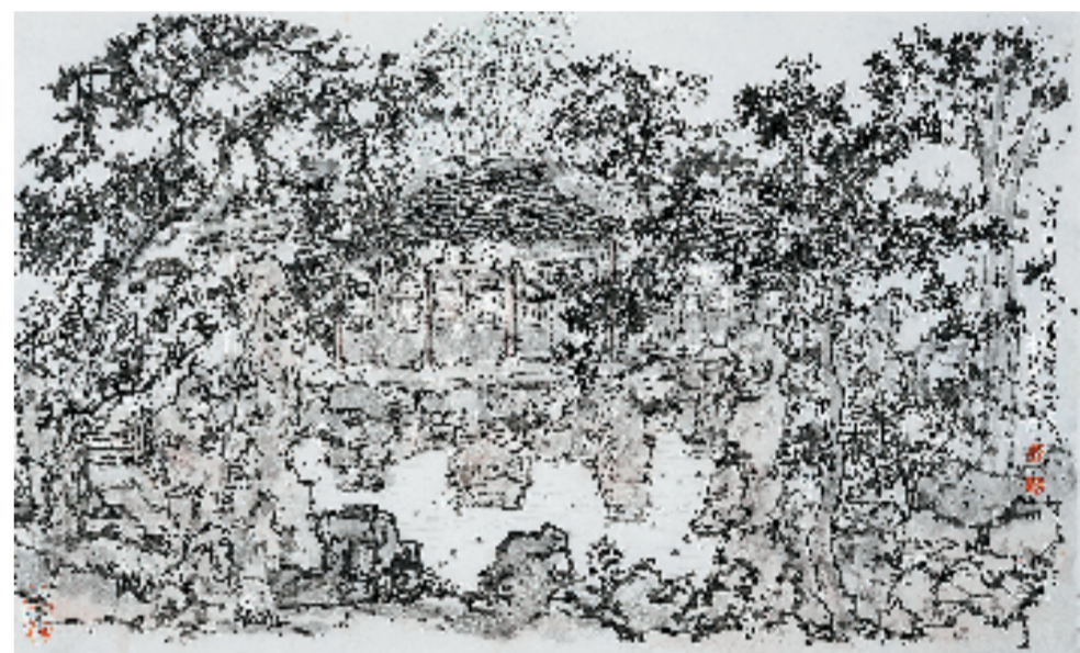
林海钟 常州园林写生系列一