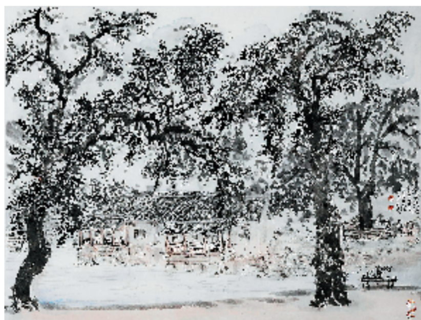
林海钟 焦溪古镇写生系列二