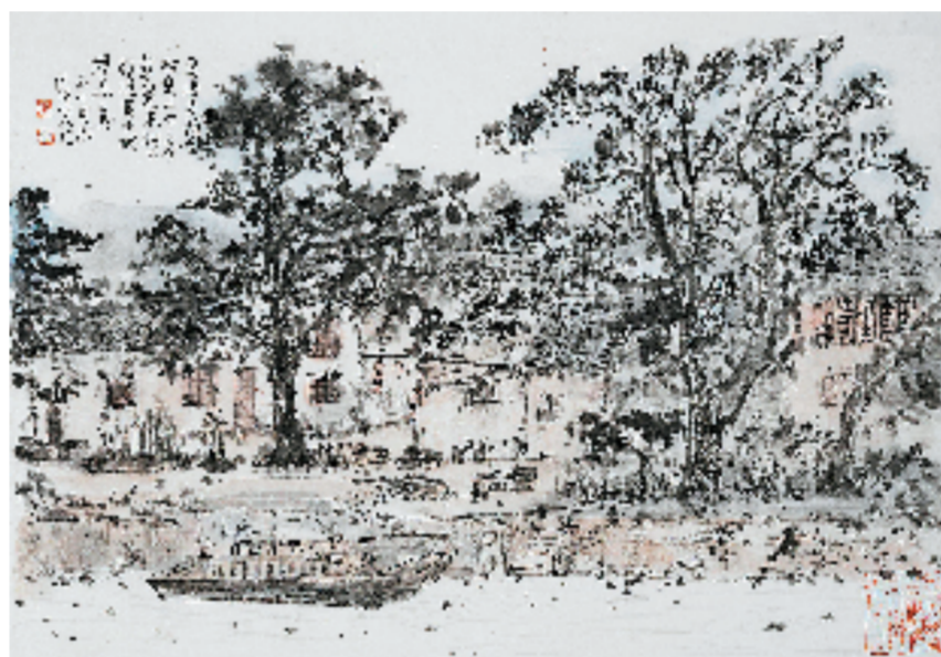
林海钟 焦溪古镇写生系列一