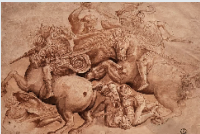
▲图3-2 佚名(临摹达·芬奇画作) 骑士的战斗(《安吉里之战》局部) 纸本钢笔墨水画 约1553年 乌菲齐美术馆藏