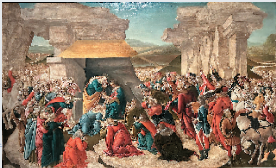
图2 波提切利 三博士来朝 木板蛋彩画 107.5×173cm 约1490-1510年 乌菲齐美术馆藏

这是文艺复兴早期流行的肖像画样式:理想化的人物侧面像。被画的女子通常都是贵族妇女,画家作画时,她们把金发高高盘起,戴上自己最得意的首饰,显示出高贵的气质。(如图1)