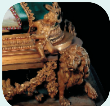
18世纪 铜镀金象驮琵琶摆钟

狮子是异域猛兽，两千多年前传入中国后，与中国文化融合，形成独特的狮子文化。狮子的用途大致分为镇墓与镇宅、佛教护法、喜庆娱乐三个方面，时至今日，为我们留下了丰富的狮子主题文物。我们身边有很多地方有狮子装饰，你发现了没？