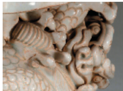
景德镇窑青白釉双狮枕 狮头细节