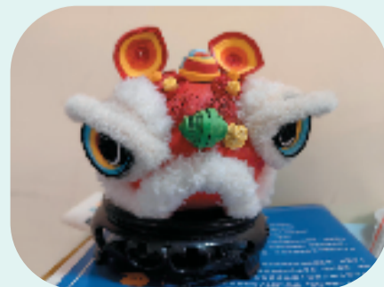
(作者供职于浙江展览馆)