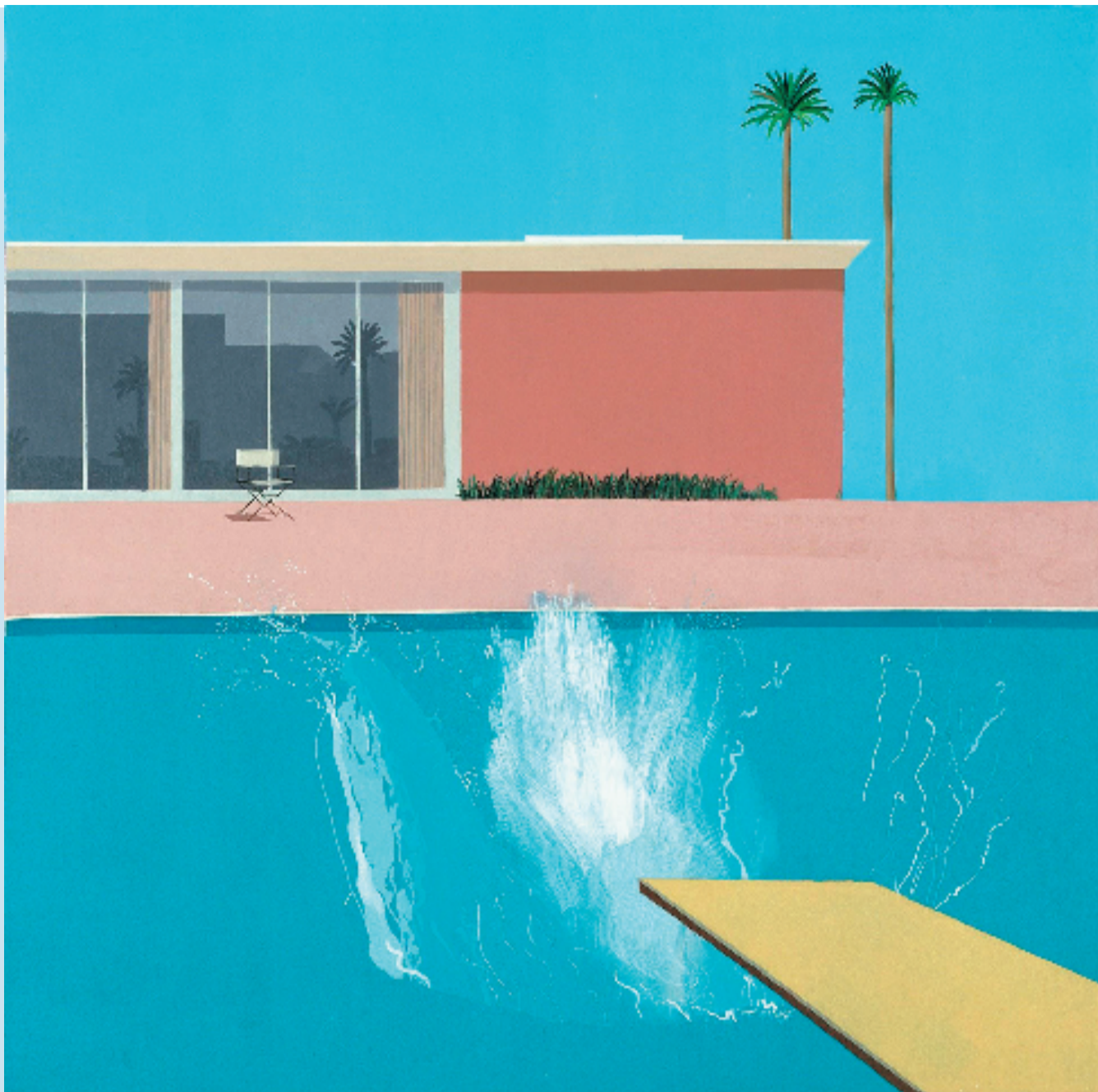
大卫·霍克尼 更大的水花 1967年