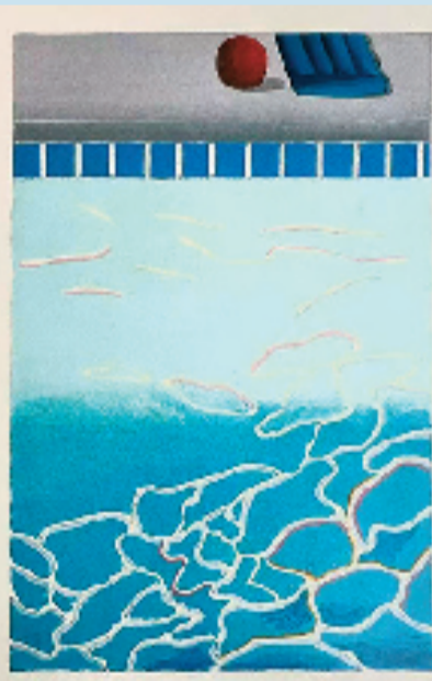
大卫·霍克尼 四种不同的水 1967年