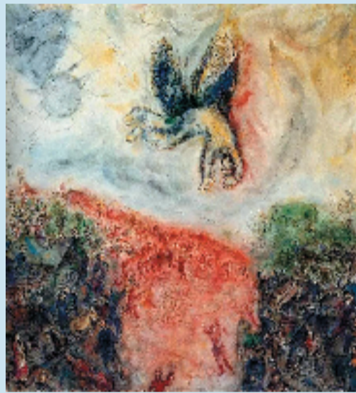
夏加尔 伊卡洛斯的坠落 1975年