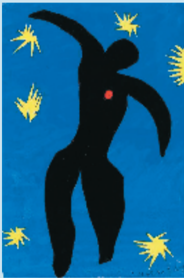
亨利·马蒂斯 伊卡洛斯