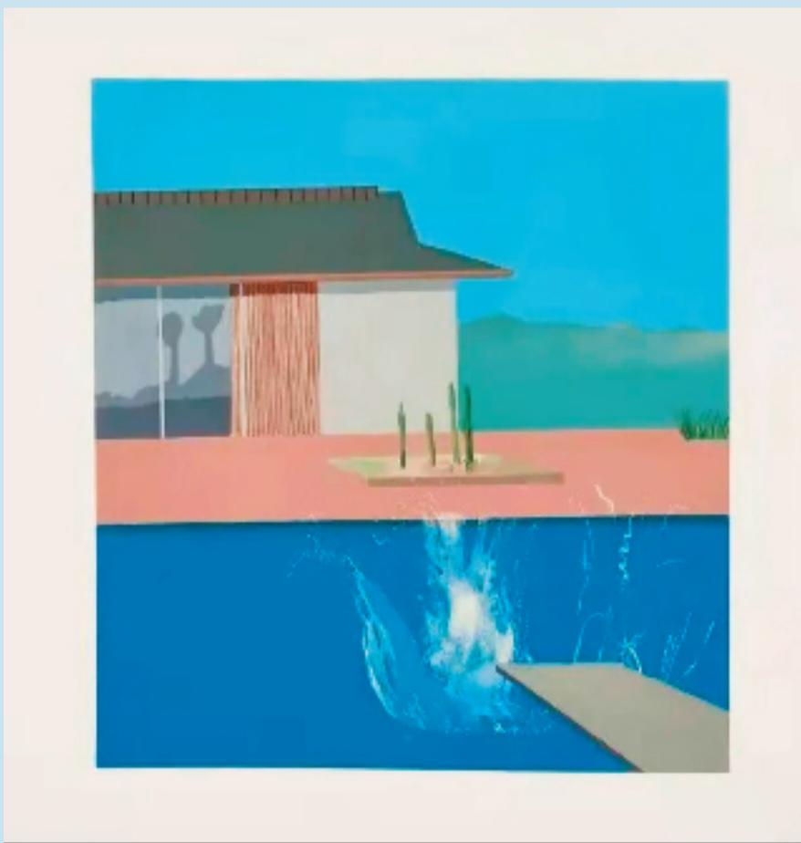
大卫·霍克尼 水花 1966年