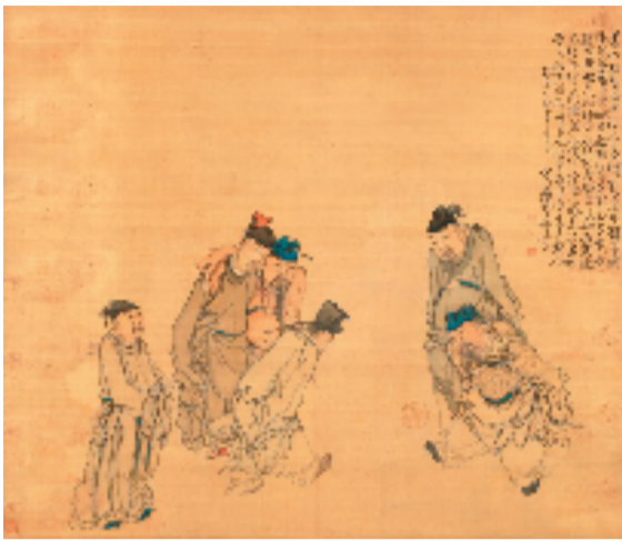
黄慎 蹴鞠图轴 1755年 绢本设色 天津博物馆藏

他们将文人画从梅兰竹菊扩展到寻常蔬果，从文人雅士扩展到市井平民，让文人画有了世情温暖与人间烟火。他们的作品中，既有对社会黑暗、民生疾苦的批判，也有对自身命运坎坷的慨叹，更有对高洁人格的坚守、对自由精神的追求，以及对平凡生活的热爱。正是这种