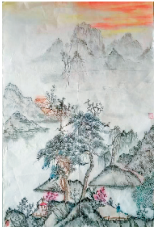
吴秀珍 春晖 国画