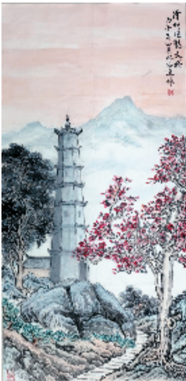
林水通 漳州旧龙文塔 国画