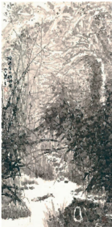
俞良忠 横过春山野树深 国画