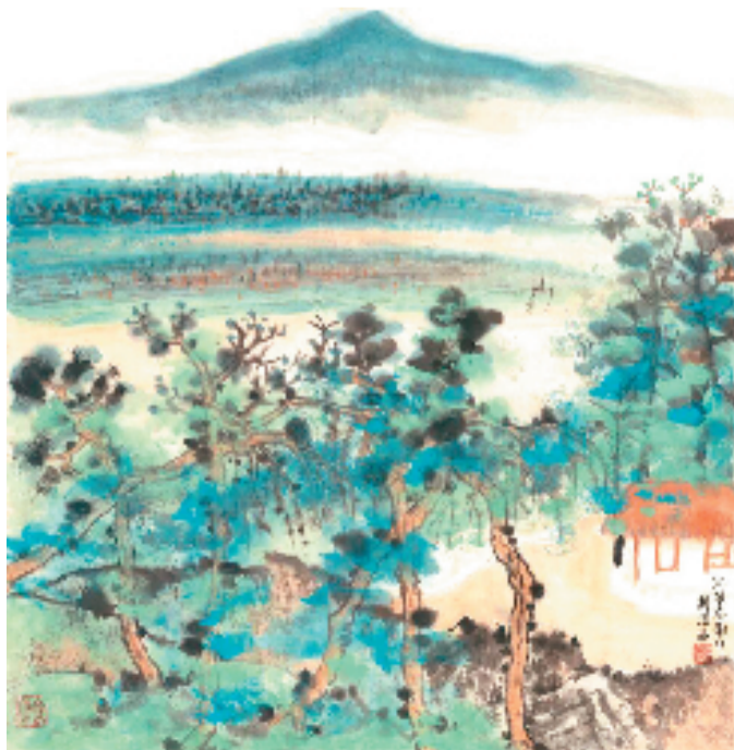
赵洁 江旷春潮白 国画