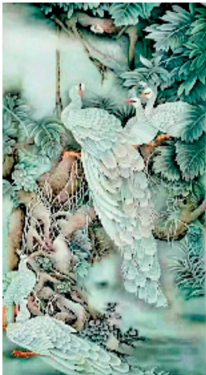
沈谊云 吉祥如意 国画