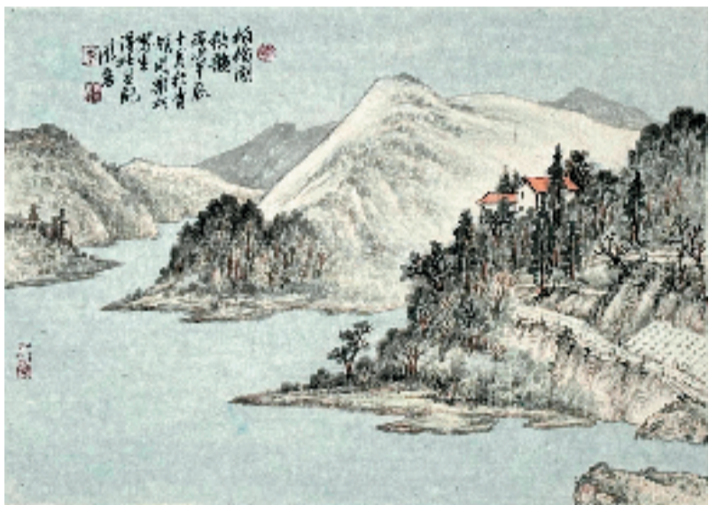
李永宏 柏杨湖秋韵 国画