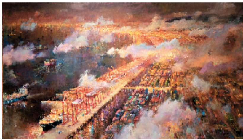
陈继武、张曦 大港雄姿 175.5×300.5cm 油画 2025年