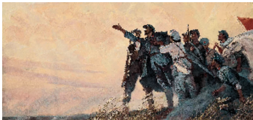
朱乃正 长征壮曲——让革命骑上骏马前进 128×270cm 油画 1977年