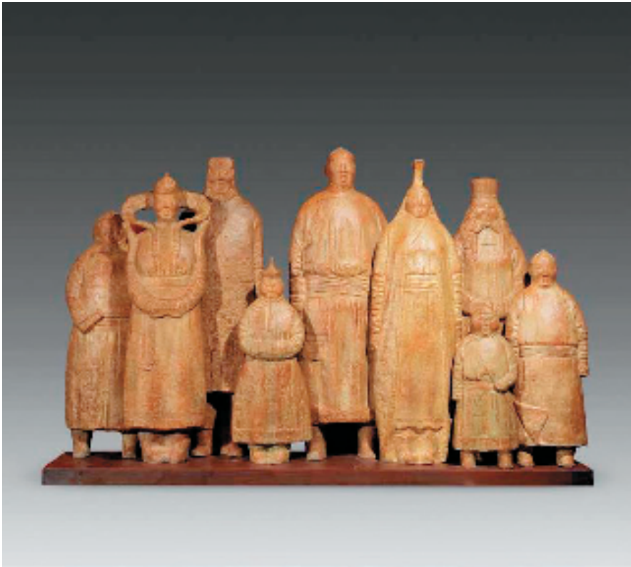
金钢 同唱一首歌 50×200×130cm 雕塑

这种探索对艺术家而言是十分艰辛的，也十分可贵。通常我们会给所看到的绘画作品或多或少地打上一种无形的标记，使得我们在观看艺术作品时有了一种习惯和态度，这种习惯可能是观看者的审美态度，也可能是从日常需求中抽取和形成的视觉习惯。艺术家要打破这种习惯在作品中建构自己的语言结构，并符合时代要求而独立存在，其难度可想而知。因为观赏者从来不会越过画家们所表现的艺术形象去寻找它的情感和意义。在本届展览的作品中，青年艺术家们为此作出的不懈探索让人感动。例如，白露洋的《隐秘的角落》、邓涵的《布景与光》所表现的画面空间看似是现实的空间，其实是空间中的幻象，它们在画家的组合中构成了一种新的物理对象。可贵的是，创作者们不仅表现了画面中的形象，还在画面语言的结构形式中更多地留下了思想流变和决绝探索的痕迹。