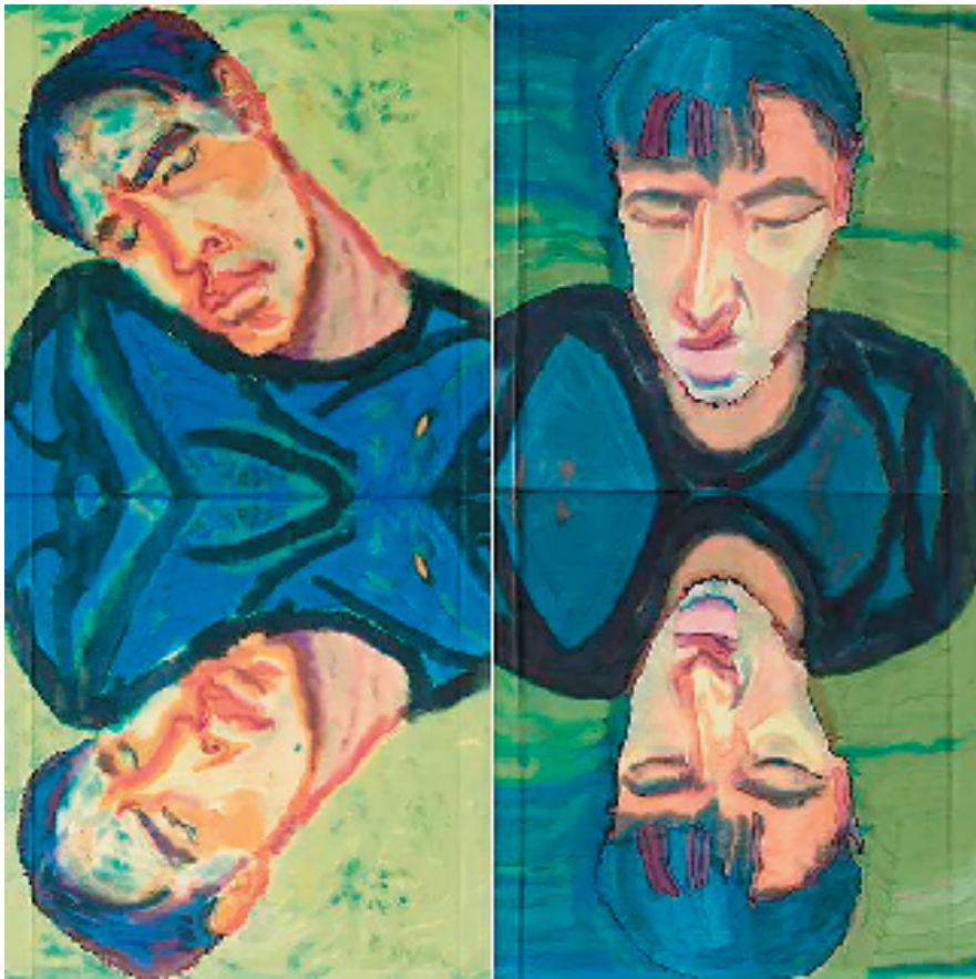
余晓娟 凯哥 130×140cm 水彩·粉画