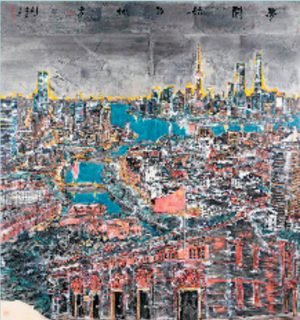
贾茹 梦开始的地方 200×186cm 中国画