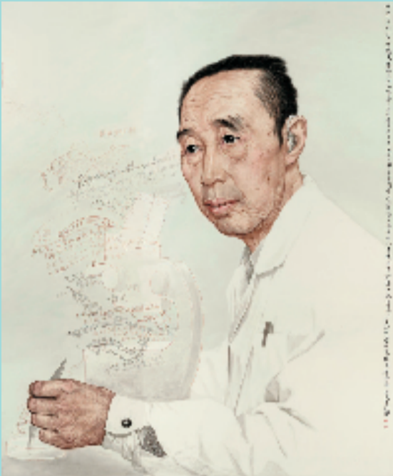
余宏达 童第周肖像 230×194cm 中国

我很庆幸自己遇见了藏区,如果说绘画是我的灵魂伴侣,那么藏区以及我热爱的土地和人民就是我安放灵魂的港湾。无论何时,我对艺术的热爱只会愈加深沉执着,仁慈、良知、虔诚和爱会伴随我和我的艺术不断生长。