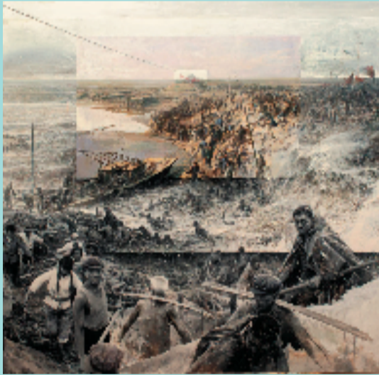
单飞达 大围涂 190×197cm 油画

在这次选择《童第周像》作为参赛作品,我做了一个大胆的尝试,因为参展效果好的是人物组合,肖像画只画一个人的半身,画面的感染力要比那些人物组合的主题性弱很多。那怎么创新呢? 首先从参展效果上来做,参展要求是240×200cm,我就画到最大,这样视觉效果好,醒目。偌大的画面上,只有头跟手画得特别深入细腻,其他的都做了减法,舍去了很多东西,大片的留白,做到极简,突出重点。像显微镜之类的器物只是勾个线,又在作品上做了一些破坏性的实验,比如把人物的手稿就很随意地写上去,这在以往创作中是不敢想象的,但创新就是要有这种不破不立的勇气。