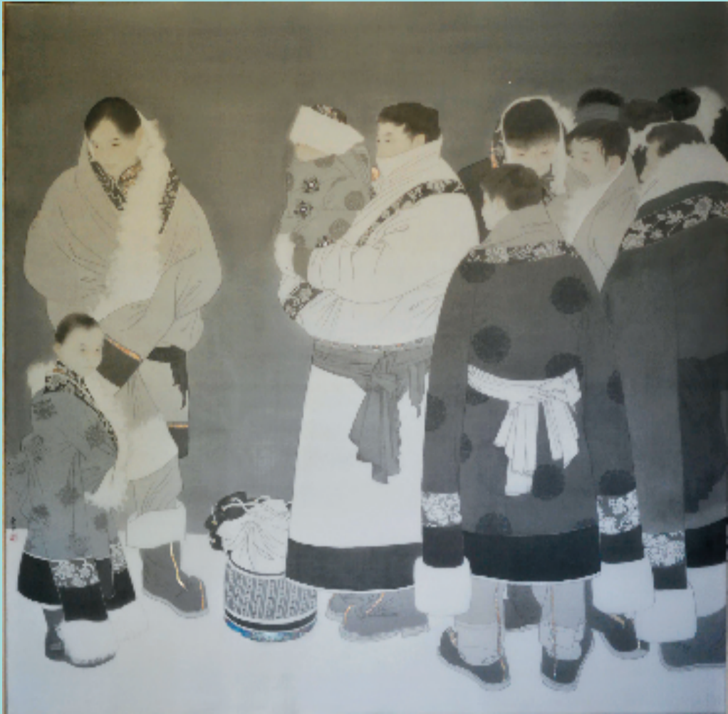
李芳 安多汉子 195×190cm 中国画

我在题材上近年来一直关注藏族人物,尤其是藏族青年,他们的形象和气质深深吸引着我,我更多关注的是他们的宁静和单纯。《安多汉子》系列、《格桑花》系列等系列作品,都是用中国传统工笔画的语言叙述藏族青年的内心世界。在刻画人物的神情方面,工笔画精勾和细染的语言非常适合表现他们精致的五官、坚定平和的眼神,以及他们带有强烈形式特征和质感的民族服饰。在勾线的基础上,我有意弱化人物的体积感和光感,而是用高染法表现人物结构特征,用平涂法表现人物衣服的纹理,以此确定画面单纯的基调。色彩的基调也控制在灰色系,总体上呈现出黑白灰的画面节奏,进而与弱化体积的表现手法形成呼应,营造出画面的宁静氛围。简约浑厚,是我在画面里期望营造的气息和情境。