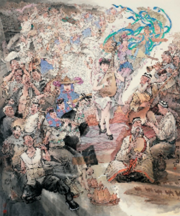
罗小珊 丝路乐韵 238×198cm 中国画

具体画面构成上,老腔、南音和木卡姆以横向方式展开,相互渗透的构图完成对其形式的描述。画面中心以南音衣着弹奏琵琶的少女与其背后的源于敦煌壁画图式的飞天,象征传统音乐形式(作为非物质文化遗产的一部分)在地域和时间上的传承。背景和前景中的地域性符号表达了三者作为非物质遗产所处的地域和文化背景差异,而最终归为一体的团块构图,则完成了对融合的表述。