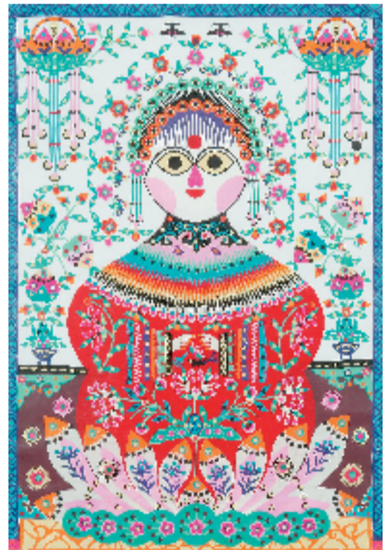
库淑兰 剪花娘子 剪纸

本报讯 小君 日前，由陕西省文化和旅游厅指导，陕西省美术博物馆主办的“花间世界——陕西省美术博物馆馆藏库淑兰作品研究展”在陕西省美术博物馆隆重开幕，该展览被文化和旅游部评选为“2022年全国美术馆馆藏精品展出季活动入选项目”。