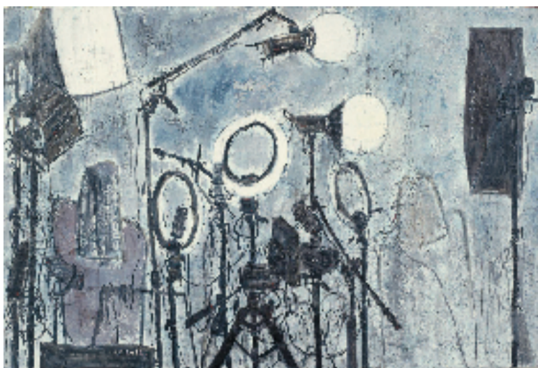
陈迪 2号直播间 150x100cm 油画

本次展览主题鲜明，聚焦“喜迎二十大”重要节点，以毛泽东同志《在延安文艺座谈会的讲话》发表80周年为契机，鼓励引导广大美术家和美术工作者融入时代、扎根人民，从主题创作出发，在关注城市建设、城市生活、城市人文中深化对艺术本体的研究和探索。从入展作品来看，扑面而来的生活气息传达着城市温度，全方位全景式展现了新时代的精神气象，集中呈现了新时期上海油画对现实主义题材创作的思考。周长江作为此次油画展的特邀参展者认为，对于两年一届的专项展览而言，“新鲜感”是很难得的，而且不仅仅是年轻人，老画家们也在不断寻求新意，作品风格和艺术手法上的丰富度又让展览具有了相当的“完整性”。