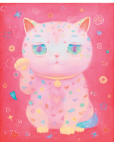
张子叶 福星驾到 68x55cm 2022年

活动邀请了国内主要的10所美术学院(中央美术学院、中国美术学院、清华大学美术学院、广州美术学院、四川美术学院、鲁迅美术学院、西安美术学院、湖北美术学院、天津美术学院、上海大学上海美术学院)的艺术家的作品汇聚重庆。同时，作为