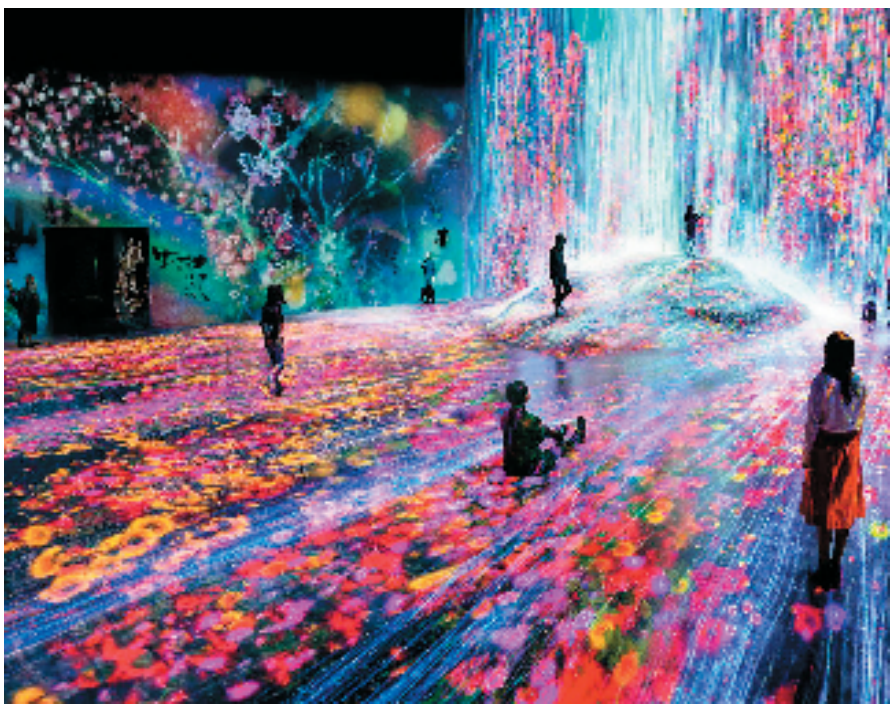
东京的teamLab 无界数字博物馆