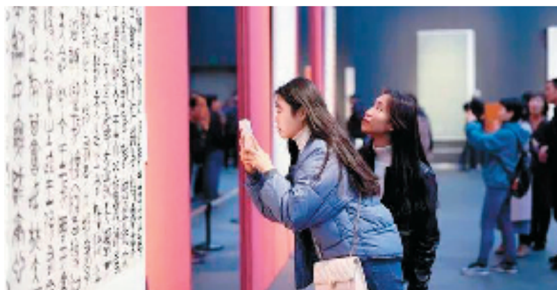
“全国第十二届书法篆刻展览”观展现场(资料图片)