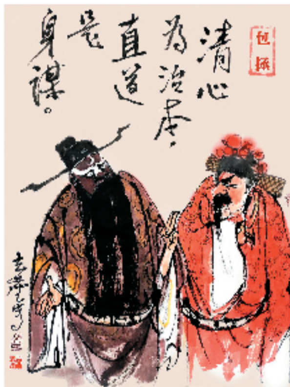
——清心为治本,直道是身谋。