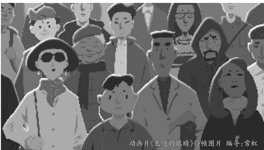
动画片《天使的眼睛》静帧图片 编导:常虹

奖(最佳中的最佳)获奖者。一年中的所有月度优胜者将有资格成为被提名者,并在此选择过程中相互竞争,以成为优胜者的最终获胜者。这些年度获奖者名单将在电影节网站上公布。