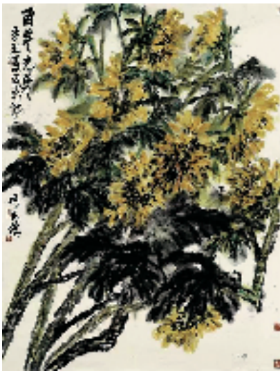
何水法 百年光华 257×197cm 2021年

这十年来，何水法美术馆始终践行加快绍兴文化场地建设、提升绍兴城市品位的建馆宗旨。充分发挥名人效益，定期举办展览活动，为省内外游客和广大市民朋友提供优质的文化服务。自建馆以来，举办了近百场展览、座谈和公教活动，接待游客20万人次，多次引进波兰、乌克兰等国际化的油画交流展览，吸引了众多年轻人前来观展，为古城注入新的生机和活力。 这十年来，何水法美术馆形成了“青藤新韵”——中国画作品展、“扇舞秋风”——成扇作品展、“三人行”——中青年艺术家作品推介展等品牌展览，以及