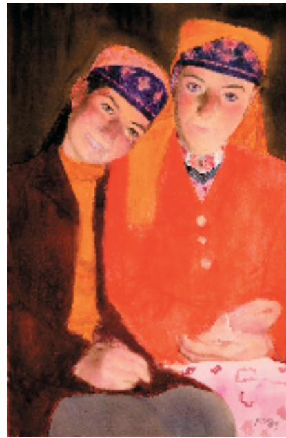
陈坚(1959-) 塔吉克两姐妹 98×64cm 水彩 2007年 中国美术馆藏(2018年艺术家捐赠)