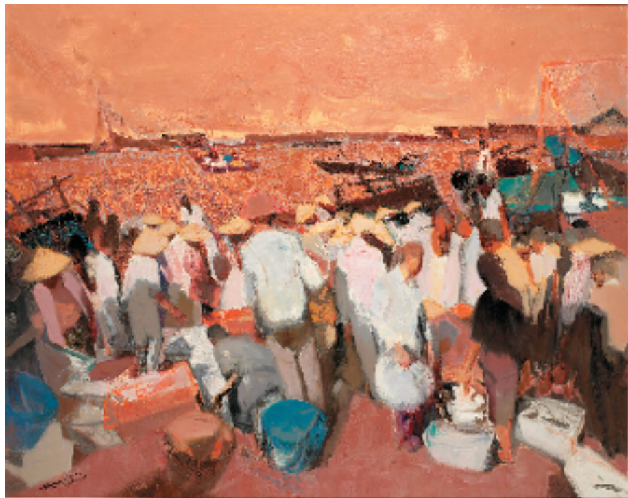
赖培文(1972-) 风清气晏之二 118×149cm 油画 2020年 中国美术馆藏(2021年艺术家捐赠)