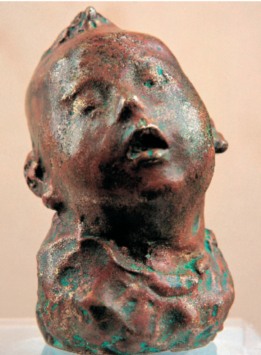
吴为山(1962-) 睡童 11×7×6cm 雕塑 1998年 中国美术馆藏(2017年吴小平、吴霜捐赠)