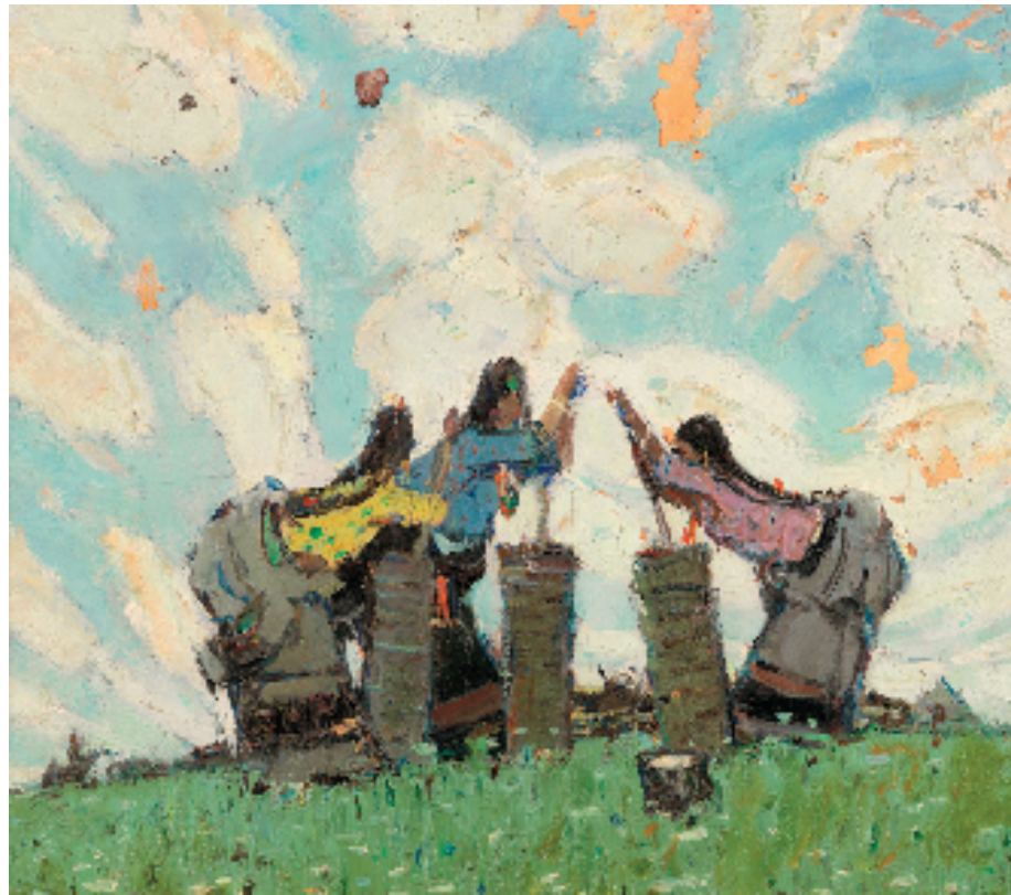
马常利(1931-) 草原上 150×162cm 油画 1981年 中国美术馆藏(2015年艺术家捐赠)