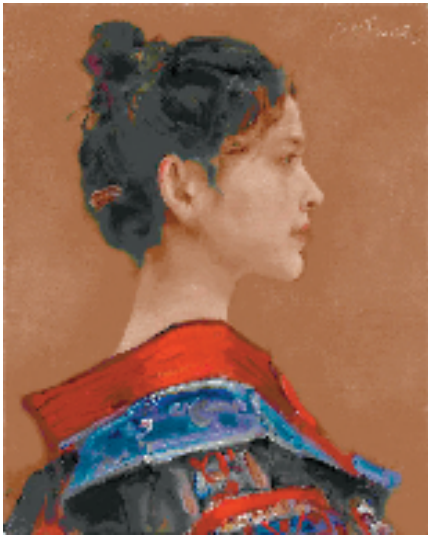
庞茂琨 苗女之二 50×40cm 油画 2022年

同日开幕的“首届都市艺术节优秀作品展”由重庆市文化和旅游发展委员会主办,重庆美术馆承办,展览持续至2月19日。展出首届重庆都市艺术节自办主体展览活动中特邀、优秀作品107件,其中“巴蜀文旅走廊”、“长江经济带”、“一带一路”三个主题的优秀美术作品11件,特邀作品45件;“匠心——重庆市工艺美术大师和非遗代表性传承人精品展”优秀作品51件。集中呈现了川渝两地、长江经济带沿线、“一带一路”区域的文化风采、风土人情、自然风貌,展示了一批特色鲜明的文化艺术精品及美术创作成果,展现了时代巨变和新时代的美好生活。对于加强区域间的文化艺术对话交流,提升工艺美术与现代社会生活的