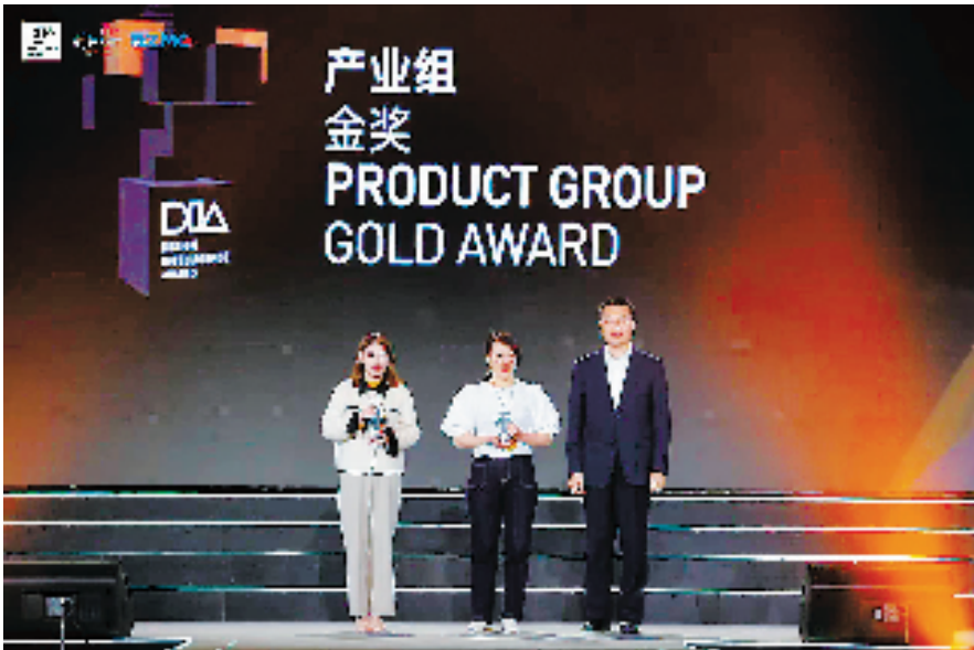
浙江省副省长卢山(右一)为金奖获得者颁奖

“数化·进化——中国设计智造大展”展出DIA优秀获奖作品近四百件，共分为设计联合国、文化创新、生活智慧、产业装备、数字经济、2065未来图景、Design·Will讲堂、设计新青年等展区，以多元化的视角探讨并共享解决关键性社会问题的新方法和新模式。展览特邀DIA海外分赛区及国际工作站负责人共同参与展览策