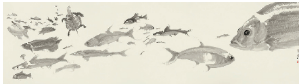
周京新 2023鱼-2 103x366cm 中国画