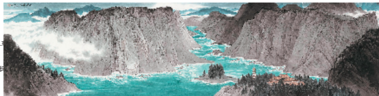
高云 上善若水 34x138cm 中国画