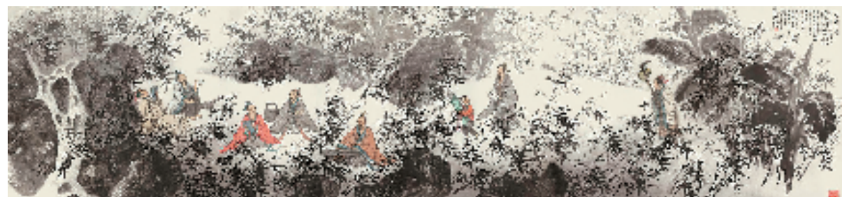
徐惠泉 竹林七贤 178x768cm 中国画