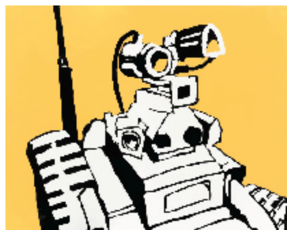
刘彬 桃叶渡瓦力 120x160cm 版画