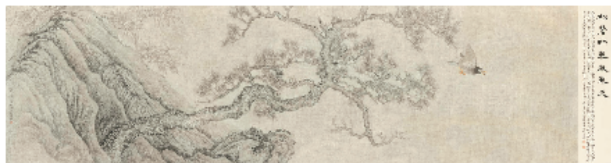
王法 松苍竹翠岁寒天 100x370cm 中国画