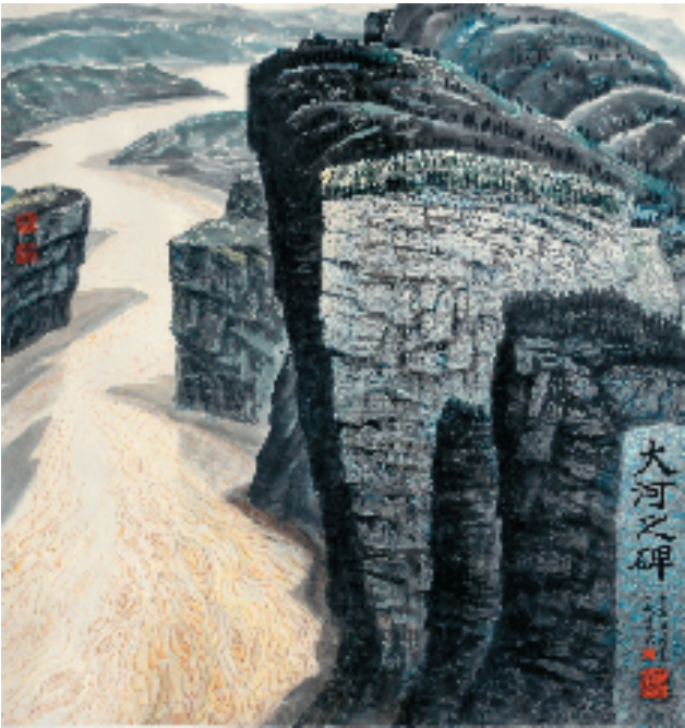
樊林 大河之碑 106×101cm 2000 年