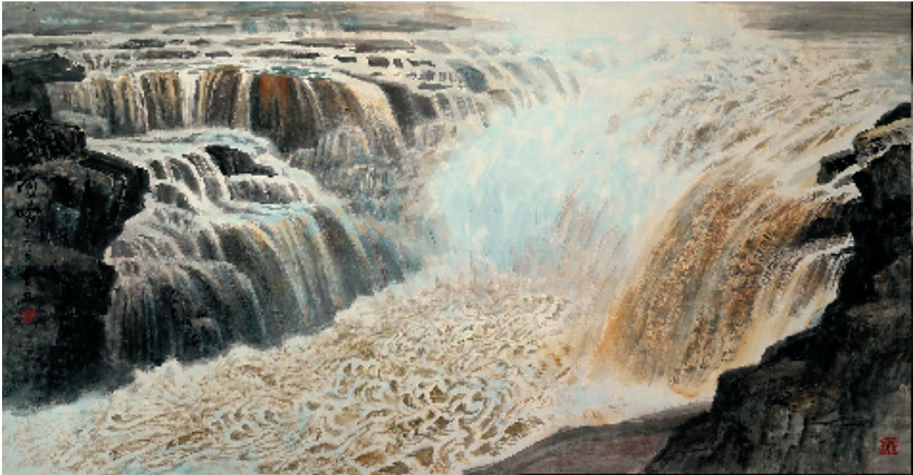
樊林 黄河吟 95×180cm 2019 年