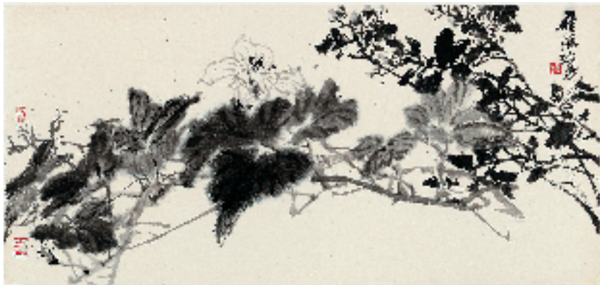
刘海勇 霜华 75x39cm

本报讯 见习记者 施涵予 3月31日,“天下有风——刘海勇中国画作品展”在浙江展览馆开幕。