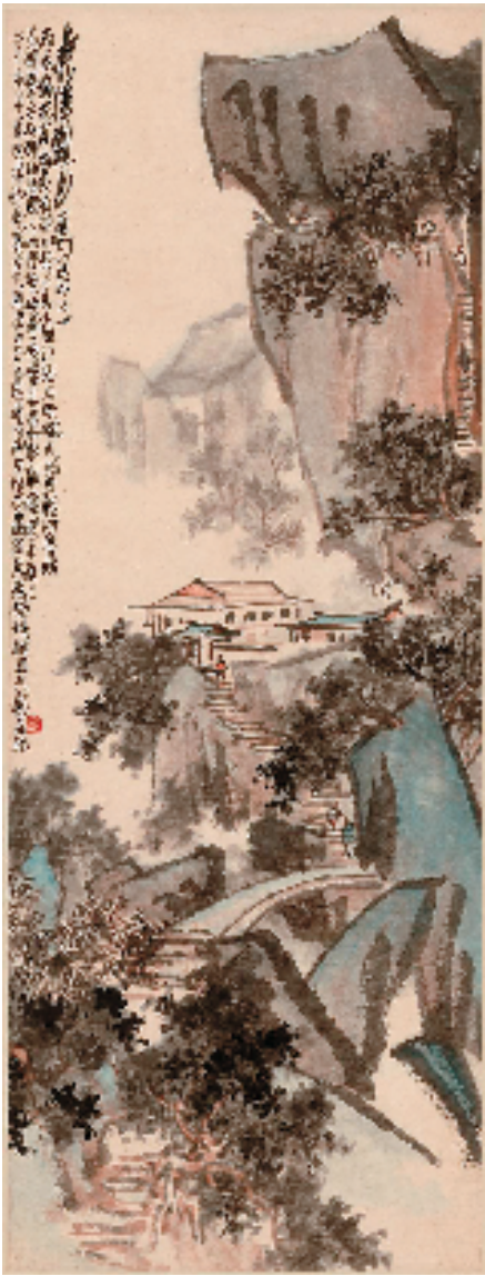
张晓寒 虎溪观月 114x43cm 1976年