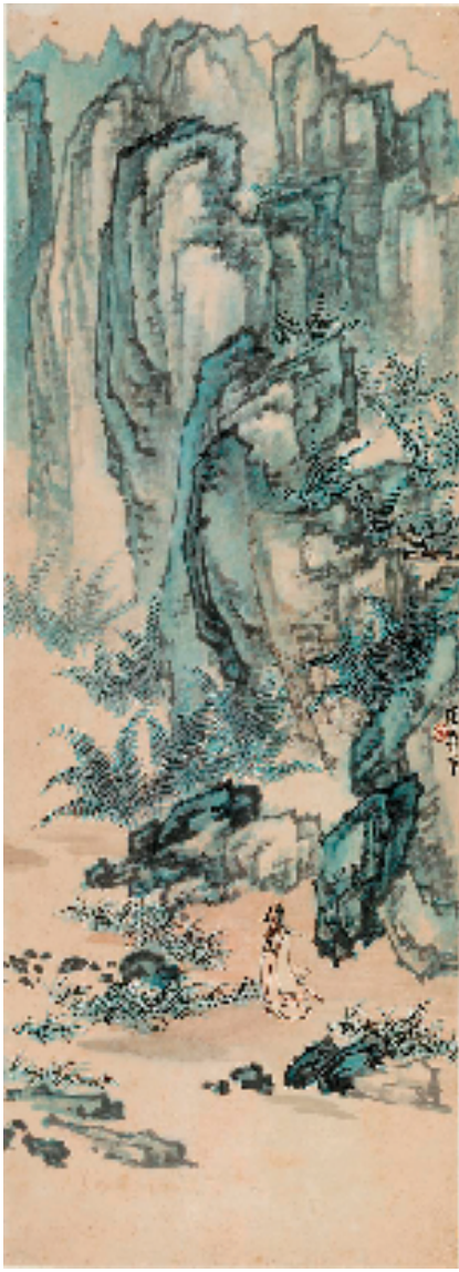
张晓寒 怀沙图 114x41.5cm 1969年