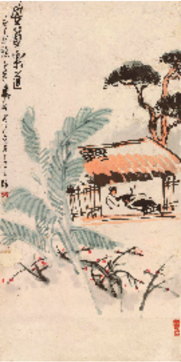
张晓寒 安贫乐道 67x34cm 1962年