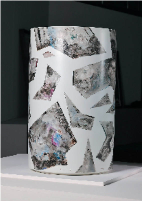
白明 陶瓷简史·卷钗