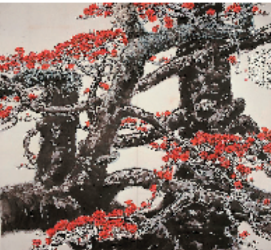
黄志坚 龙虬 176×192cm 1982年 广东美术馆藏

本报讯 通讯员 赵越 7月1日,“笔墨常随日月新——黄志坚捐赠美术文献展”在深圳何香凝美术馆开展。本次展览是“广东省美术馆青年策展人扶持计划”项目之一,由广东美术馆和深圳何香凝美术馆联合举办,何香凝美术馆馆长蔡显良担任展览学术指导,广东美术馆馆长王绍强担任展览总监,广东美术馆胡宇清为展览策展人。