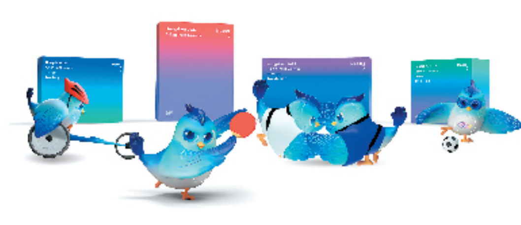
亚残运会吉祥物运动造型应用导则设计 衍生品