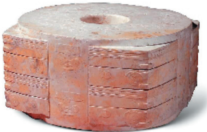
“玉琮王”于1986年在良渚反山遗址出土