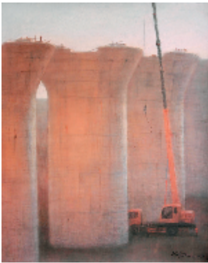
奚忠恕 《等待的风景》 148x118cm 纸上色粉 2020年

2020年，在中共浙江省委宣传部的领导和支持下，浙江省文联实施“浙江省文艺名家孵化计划”。美术名家孵化计划由中国文联副主席、浙江省文联主席