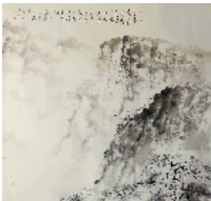
龚心甫 奇峰远眺彩云霏 145×154cm

开幕式上还举行了龚心甫精品画作捐赠仪式,龚心甫将自己的20幅中国画精品无偿捐赠给河南博物院,包括山水、花卉、金鱼、书法作品等,其中,《华山之韵图》是龚心甫“直笔皴”的代表作。“河