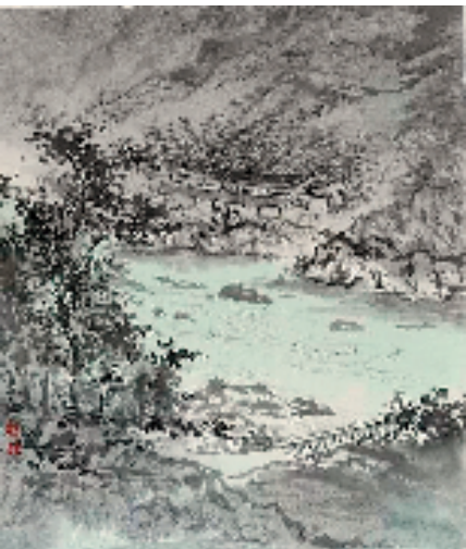
王珊 桐木关百年制茶青楼 34×39cm