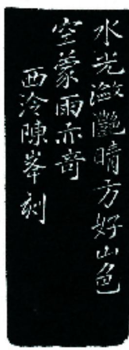
释文： 山色空濛雨亦奇(连款)