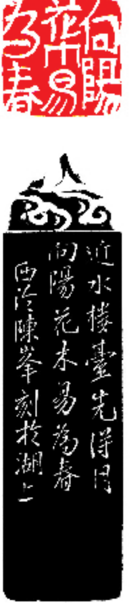
释文： 向阳花木易为春(连款)