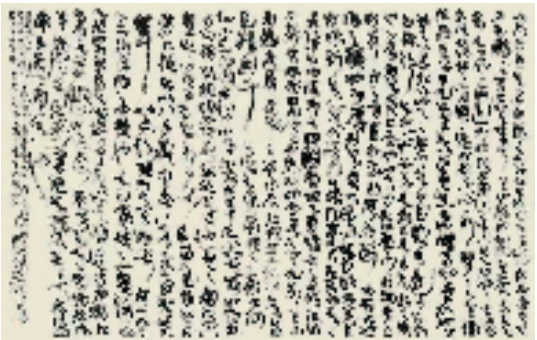
王冬龄 逍遥游 2003年

王冬龄笑道：“我可能是一个最具有争议的书家，我会把网友的评论记在本子上，经常拿出来看看。”在他看来，正是因为大家同样热爱中国书法，才会关注到你，才会评论你、评论乱书。“我有一点比较好，就是心理承受能力强。”