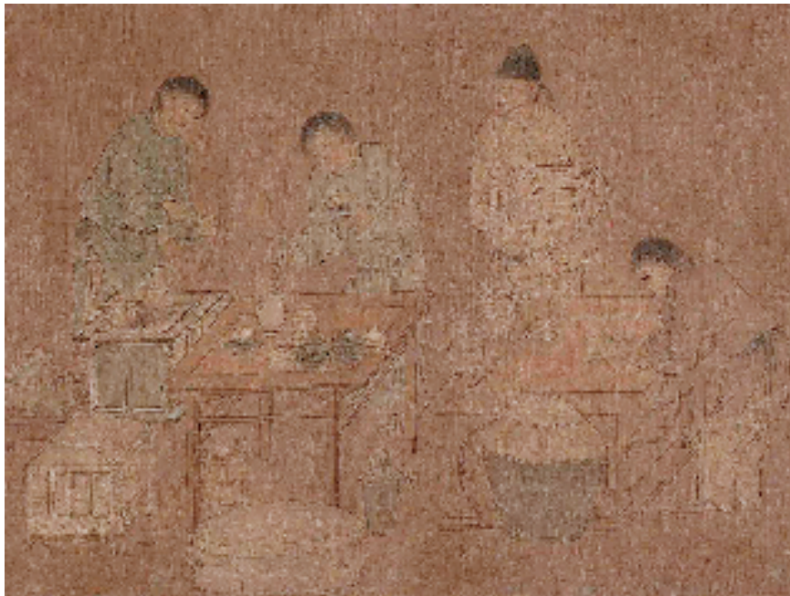
宋 佚名 春宴图(局部)

本报讯 报艺 9月2日,“茶·世界——茶文化特展”在故宫博物院午门展厅正式与观众见面。本次展览由故宫博物院主办,汇集国内外30家考古文博机构的代表性藏品,展品总数达555件(组),以鲜明的主题、宏大的规模,立体展现穿越历史、连通地域、融合民族的中华茶文明。