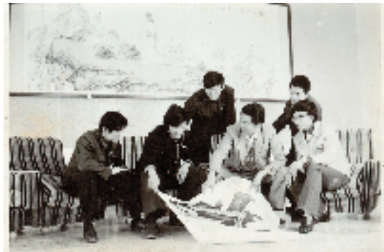
特艺系同学在聆听范曾(右三)授课