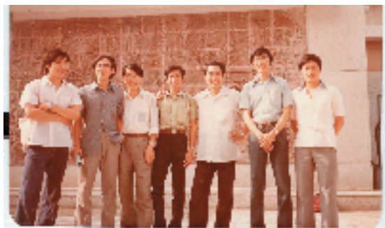
特艺系七九级部分同学毕业时与范曾(右三)在校园合影