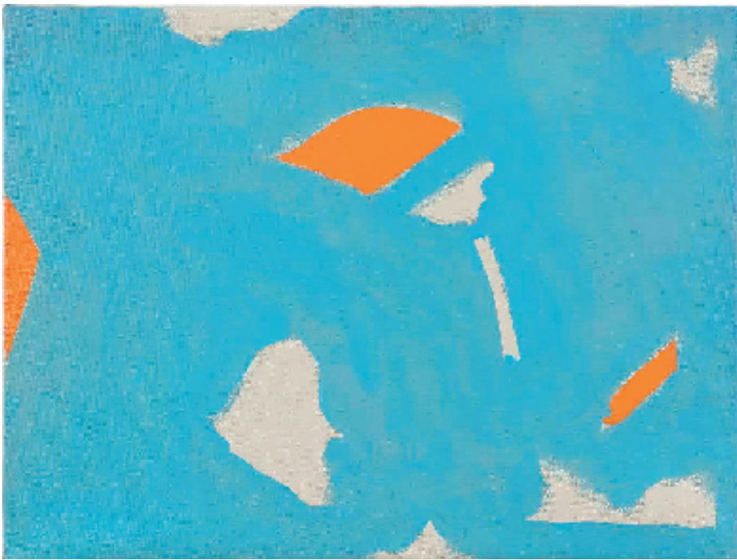
贝蒂·帕森斯 晴天 布面亚克力 1965年 亚历山大·盖瑞协会藏

她取下随身携带的画箱，走进一个山脚下的牧场。她黑色的长裙扫过漫地的牧草，有些许草籽粘在裙边，好像是某一种她也说不出的牵挂。和牧场主交涉后，她们得以被允许在这里住下。对于她来说，这周围的环境仿佛是天赐良缘——有些事情就是会这么恰到好处，简直比你期待的还要恰到好处！兴奋之余，她拿起墙边的一只水桶一路小跑到牧场边上。那里有一条小河，河水不算特别清澈，但青油油的牧草和旁边干净好看的水牛让人觉得这水也是绝顶的好水。