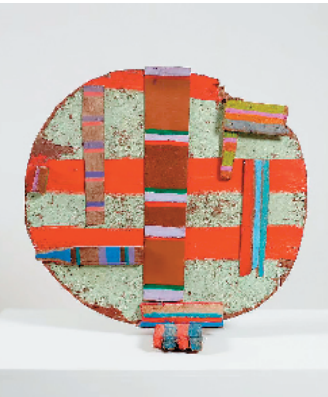
贝蒂·帕森斯 II Oglala(奥格拉拉) 雕塑 1979年 亚历山大·盖瑞协会藏