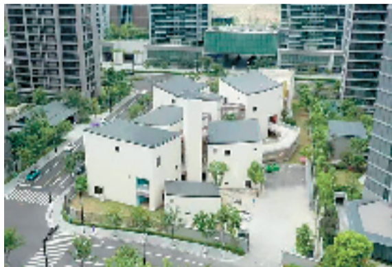
杭州亚运村保障用房

的木结构建筑,设计理念来自馨香馥郁的杭州市花——桂花,其名称源于《灵隐寺》一诗中“桂子月中落,天香云外飘”。它将为技术官员、媒体记者提供候车、休憩等服务。