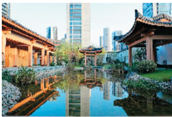
杭州亚运村 国际区村院长院