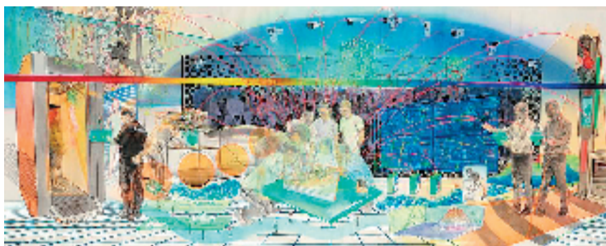
林皖 宋开智 王鹏 科技人才的娘家人——多维驱动新纪元图景 471x179cm 国画

池沙鸿表示，就自己的经历而言，他在创作中，深入生活、穿越历史，做大量的笔记，收寻大量的史学资料，触摸所有细节，将自己沉浸到历史现场，与描绘对象同呼吸共命运，领会创作主题后面的精神厚度和生命意义。“在大型的艺术创作后，自己的艺术追求有较为明显的变化，一方面是从小我向我大的精神层面拓展，一方面是加速调动自己艺术语言的变化和原生动力，展开更广阔的艺术探索的空间。”