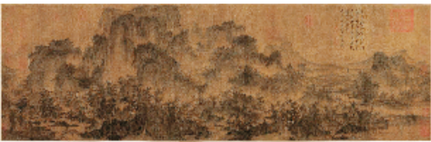
北宋 李成 茂林远岫图卷 45.2x143.2cm 绢本水墨 辽宁省博物馆藏

本报讯 齐雨 通讯员 徐梦可 日前，“美在融汇——共建‘一带一路’倡议提出十周年美术作品展”在中国美术馆开展。展览由中国美术馆、丝绸之路国际美术馆联盟共同主办，在全面梳理中国美术馆藏共建“一带一路”国家美术作品的基础上，集中展示来自60余个国家和地区的作品180件。同时还精选数十件中国艺术家的作品，以中国艺术对话世界。