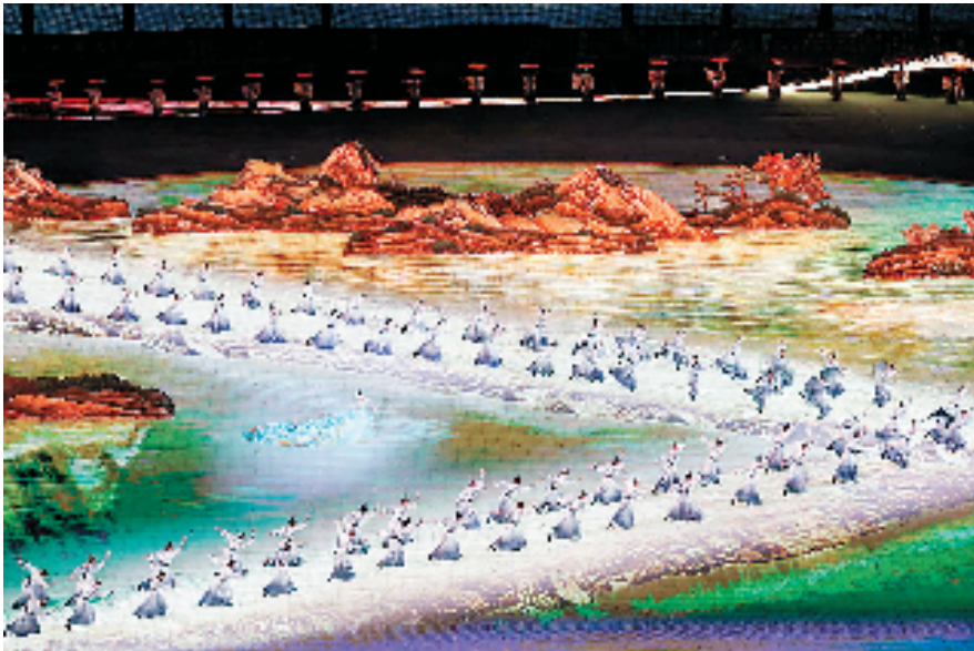
开幕式表演呈现宋韵丹青、江南风韵

杭州意韵、浙江标识和中国元素。借助科技创新的力量，彰显东方美学的独特吸引力与感染力。 开幕式表演《国风雅韵》以“画”作为载体：地屏上，“一抹丹青”将时光拉回至千年前，宋韵画卷自此翻开，寻常生活中的风雅处处可见；国风少年以地为画、踏墨而舞，简约的阵列变化、身法动作，呼应中国山水画《千里江山图》《富春山居图》所独有的留白之美，言有尽而意无穷；错落有致的立体山水映衬着江南朦胧的裸眼3D视效，营造出轻烟缭绕、水光潋潋的江南画境。 在呈现钱塘江两岸风景的水墨画上，宋韵女子翩翩起舞——她的衣裙缀满了古建筑图案，随着舞步移动，画卷上泛起“水波纹”，中式美学惊艳全场。莲叶舒展于西湖之上，既有“接天莲叶无穷碧”的秀美，又渲染出烟雨江南，“山色空蒙雨亦奇”的意境唯美又浪漫。