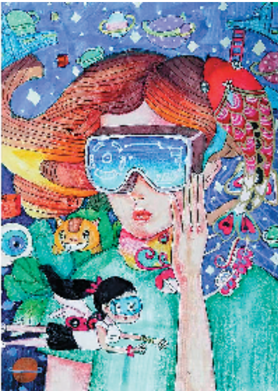
▲赵梓莹(苏州市金阊外国语实验小学) 未来生活 感受到孩子丰富的想象力和叙述的能力,画面饱满,各种有趣的元素穿插其中。小作者作画能力强,色彩感受新颖强烈,人物场景刻画生动,让人置身于童趣的科幻世界之中!