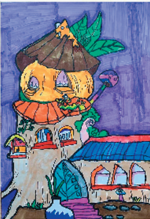
◀张思齐(苏州市吴中区吴淞江实验小学) 南瓜屋 色彩丰富,用色大胆鲜艳,构图有趣,让整个画面的视觉中心非常突出。线条运用自由奔放,画面妙趣横生,体现出童真稚趣,让人置身于他们南瓜屋的世界。