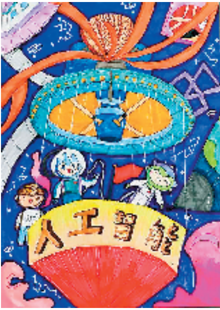
▲马逸涵（杭州市京都小学）精彩亚运 举国欢庆 感受到孩子丰富的想象力和叙述的能力，这个人工智能飞船因他所想，带来不一样的新奇体验。主体飞船和亚运三小只用色大胆突出，周围蓝色的星空背景也将科技氛围烘托得恰到好处。