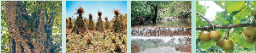
漫山野的青檀树 充足的沙田稻草 汨汨不止的山泉 神奇纸药

宣纸的生产过程具有深刻的哲学基础,如何认识自然、如何把握时间、如何理解物与天地时空的联系,都是宣纸造物的基础。宣纸制作技艺离不开自然与文化生态的整体。根据图片线索,和同伴一起讨论安徽泾县宣纸制作技艺与生态之间的关系吧!