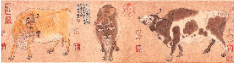
现存最早的宣纸作品 唐 韩滉 五牛图(局部) 故宫博物院藏

宣纸的神奇之处在于“时间”,它看起来“轻似蝉羽白似雪,抖似细绸不闻声”,却是世界上寿命最长的纸。北京故宫博物院珍藏的唐代著名画家韩滉(723-787年)用宣纸绘制的《五牛图》距今已有1200多年的历史,原画的面貌依旧清晰。