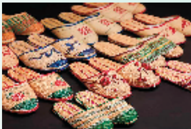
不同色彩组合的草编工艺品

成熟晒干后的黄草泛出淡黄、浅棕等颜色,给人以自然纯朴之感。徐行草编艺人在自然原色上,基于编织手法和色彩搭配原理,将红、黄、绿等高饱和度颜色自由组合,并适当运用对比色,从而获得既调和又对比的效果,赋予了黄草现代审美与鲜活的生命力。