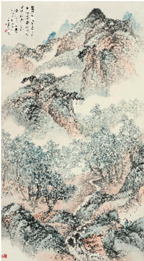
郑午昌 云山消暑精品 1949年