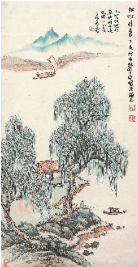
郑午昌 江村晴夏吴帆跋 1947年