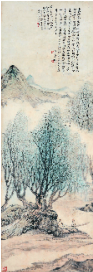
郑午昌 柳图长题 1932年