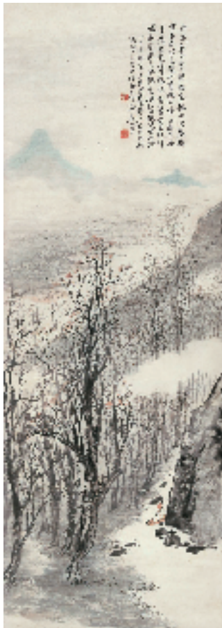
郑午昌 青山放棹 1938年