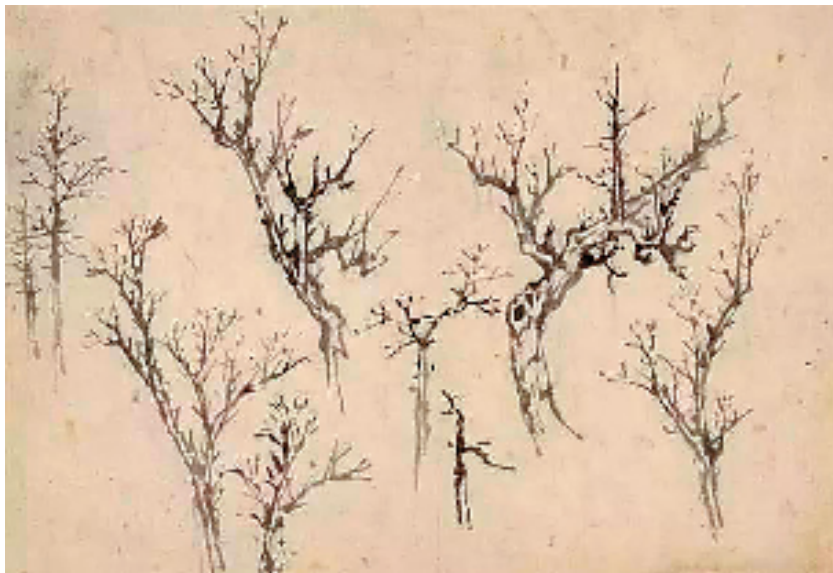
顾坤伯树石课徒稿