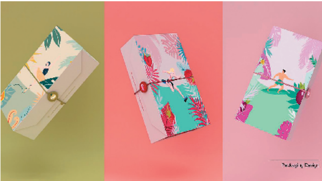
插画作品应用于包装设计